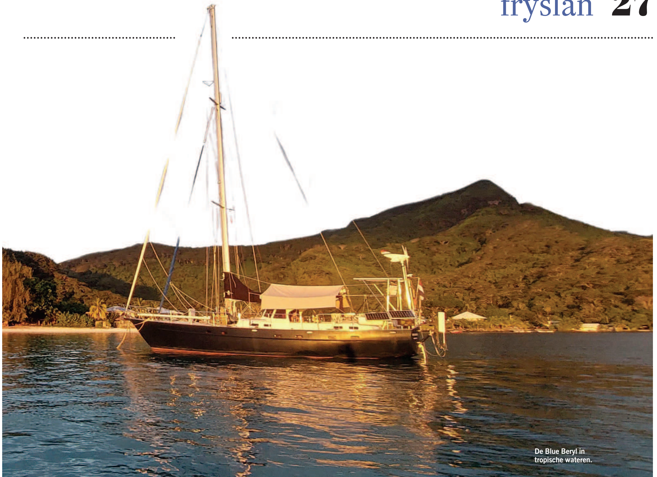
De Blue Beryl in tropische wateren.